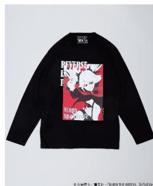
『ニニー』 ロンT ブラック Front