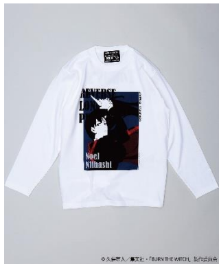
『のえる』 ロンT ホワイト Front