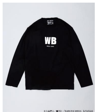
『WB』 ロンT ブラック Front