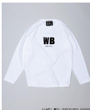
『WB』 ロンT ホワイト Front