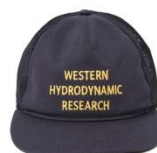
Promo Hat Mesh : Free/カラー NVY 価格 ¥ 8,800(税込)