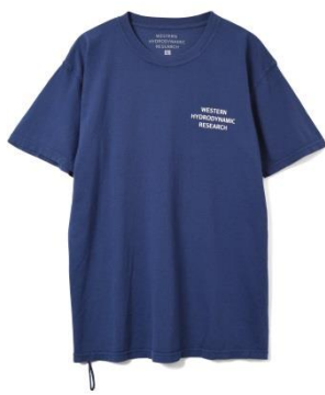
WHR Worke T Shirt SIZE M.L.XL/カラー WHT.NVY/価格 ¥ 8,800(税込)