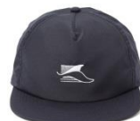
WHR Whale Tail Hat SIZE Free/カラー NVY /価格 ¥ 8,800(税込)