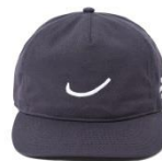
WHR Whale Bone Hat SIZE Free/カラー NVY /価格 ¥ 8,800(税込)