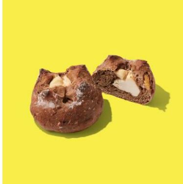
桃とパインのクリームチーズカンパーニュ