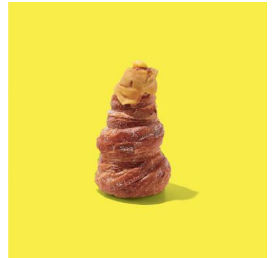
マンゴークリームの特モンブラン ¥411