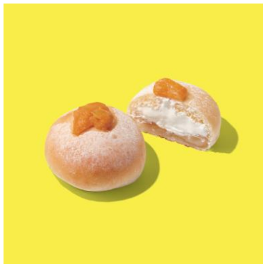
マンゴー大福館パン ¥303

蜂蜜の甘みをほのかに加えたカンパーニュ生地にピーチ、パイン、ローストセリアルを練り込みました。