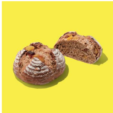
桃とパインのカンパーニュ ¥432

蜂蜜の甘みをほのかに加えたカンパーニュ生地にピーチ、パイン、ローストセリアルを練り込みました。