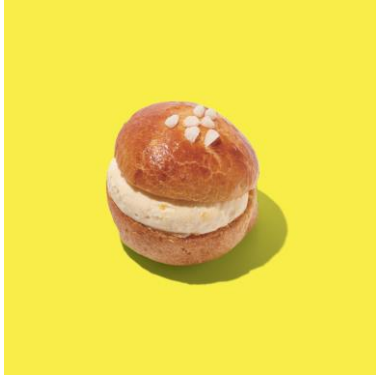
レモンクリームの特ロペジェンヌ ¥324