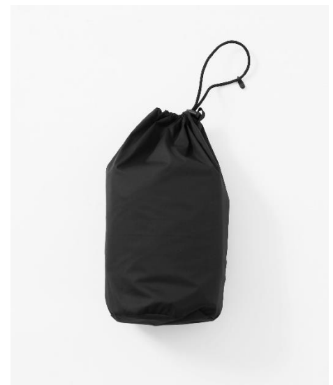
■ LASKA PLAY/パッカブル ポンチョ/¥17600/サイズフリー