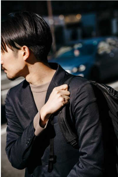
バッグを背負っても擦れづらい丈夫な素材