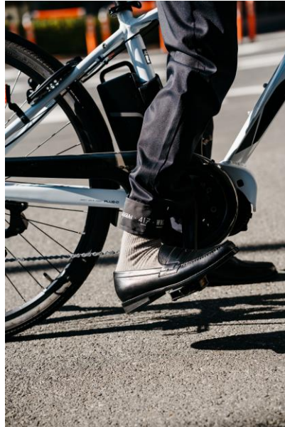
パンツ巻き込み防止のアンクルバンドが付属。 夜は光るリフレクター仕様に。