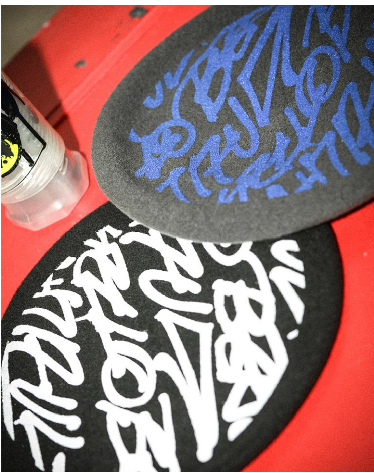
RYUJI KAMIYAMA × SARAVAH / ¥12000+tax