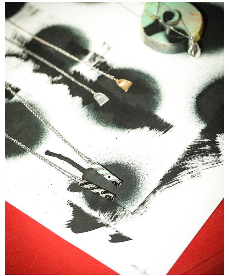
Ratface Necklace/ ¥14500+tax~¥17500+tax