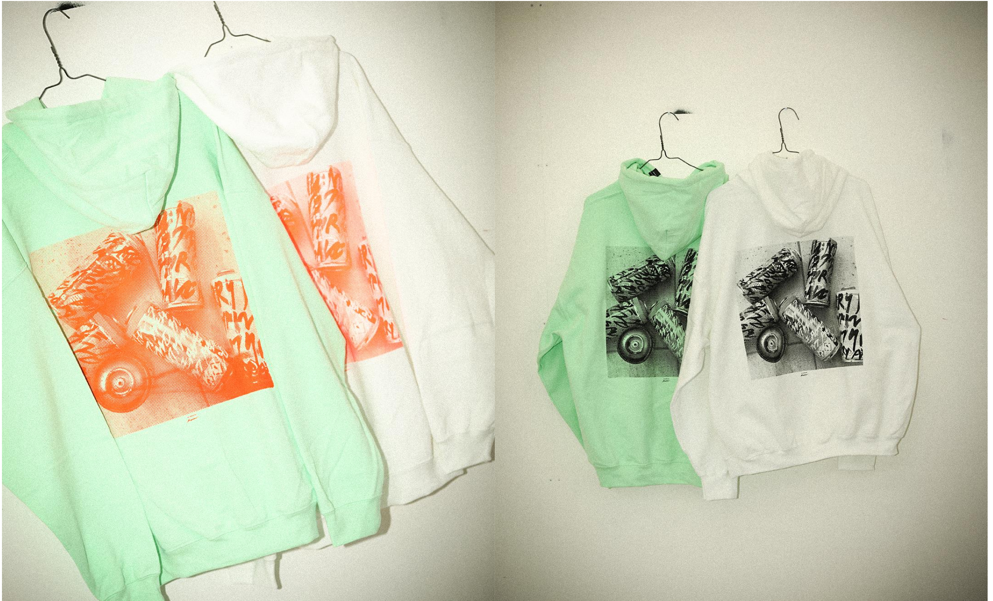
RYUJI KAMIYAMA × JS / ¥14000+tax