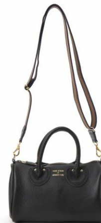
¥39000+TAX COL : Ivory/Black