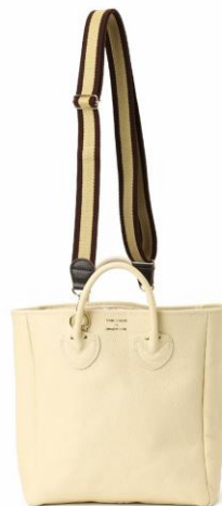
¥35000+TAX COL : Ivory/Black