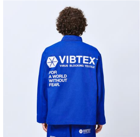
VIBTEX TWILL JKT/¥16000+tax

JOURNAL STANDARDカプセルコレクションでは「VIBTEX™」の キーカラー「白」に加え清潔感のある「青」をエクスクルーシブカラーで展開 「SWEAT HOODED」、「CREW NECK」、「PANTS」、「JKT」、「EPLON」 計5型のアイテムを販売