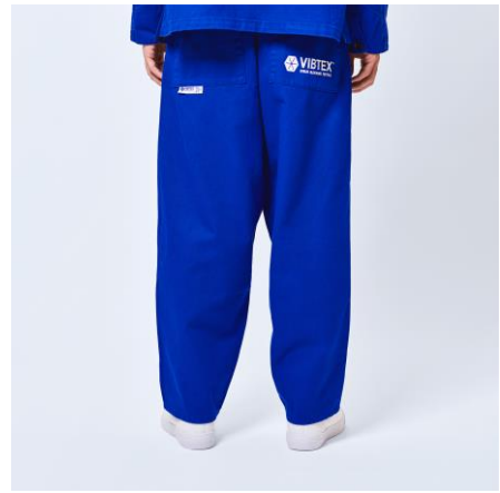
VIBTEX PT /¥12000+tax