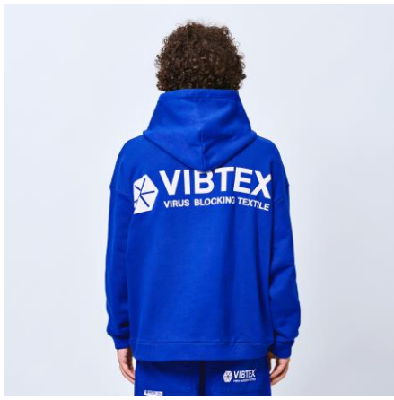
VIBTEX SWEAT HOODED /¥16000+tax