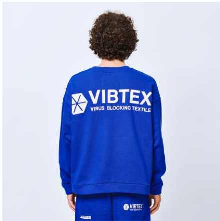
VIBTEX SWEAT CN/¥12000+tax