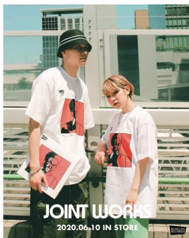
NINA SIMONW/SONG ¥6,000+tax

アカシアレコードは、パリのアカシア通りに住むステファニー・モロー主宰のコンセプトブランド。架空のレコードショップというコンセプトで、Tシャツを通じてレコードの魅力を感じてほしいという思いから、オリジナルデザインのジャケットに同プリントのTシャツをセットにした「RECO-T」や、ロゴの入ったショップグッズを展開している。実店舗を持たず、ウェブストアやポップアップストアなどのイベントで展開。