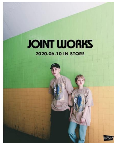
neurosis/dobby mcgee ¥6,000+tax