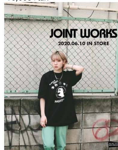
FUCK THE SYSTEM/TURTLE ¥6,000+tax