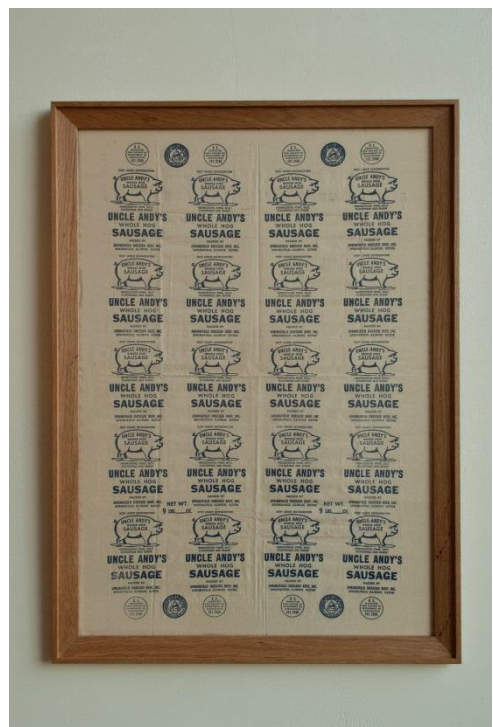
660 × 910mm ¥ 32,000-