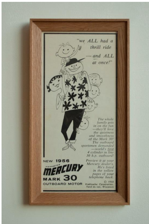
345 × 640mm ¥ 25,000-