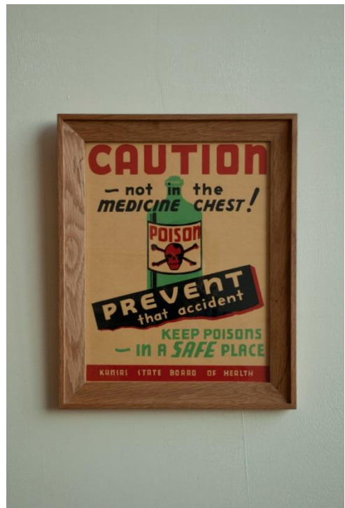
370 × 455mm ¥ 25,000-