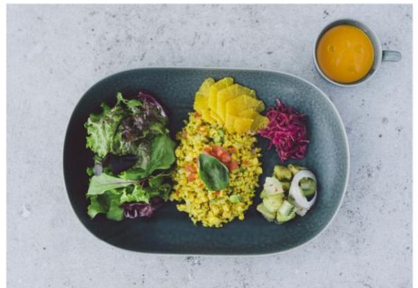
Spanish Grains Salad with Today's Soup パエリア風スパニッシュグレインズ サラダプレート with 本日のスープ ¥1,100

〈内容〉 テンペカツとアボカドのサンドイッチ／リーフサラダ／アボカドとフルーツのサラダ／赤キャベツの酢漬け／ズッキーニとコリンキー、ポテトの重ね煮／トマトとフィノッキオのポターージュ