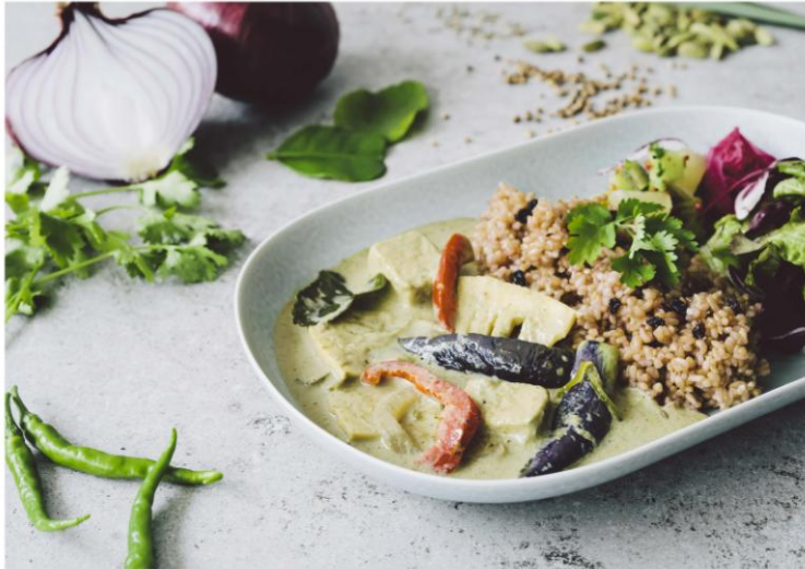
Green Curry with Aubergine & Paprika, Koya Tofu 茄子とパプリカ、高野豆腐のグリーンカレー ¥1,000

ココナッツミルクの甘みと青唐辛子のフルーティな辛さが印象的なカレー。食感を残した野菜とソースがしみ込んだ高野豆腐がしっかりと食べた応えです。