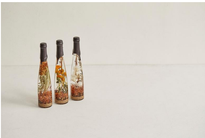
The Landscapers Plantaholic

京都にて1世紀以上も竹製品をつくり続ける公長齋小菅。積み重なった竹の模様が美しい弁当箱。余計な装飾の一切を省いた長方形に、取り外しできる仕切りと、根竹がポイントになったバンド。大人の弁当箱と、見た目はいたってシンプルで、美しい竹の積層模様が活かされた箸ケースがセットになっています。