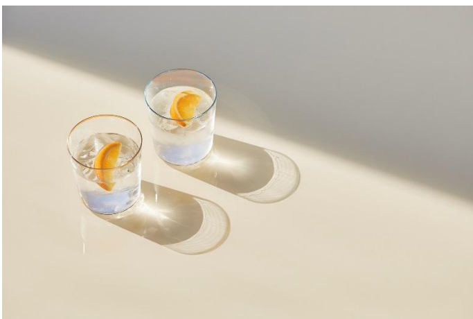
木村硝子 × JOURNAL STANDARD SQUARE グラス (2個セット)