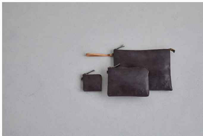
JOURNAL STANDARD SQUARE 手染め革小物

The Landscapersが植物中毒のあなたへおくる「Plantaholic」。瓶詰めされた植物は育たない、でもそれを眺めるあなたの感性を育ててくれる。植物を育てるのではなく、植物に育てられる。もはや植物依存、それが「Plantaholic」(プランタホリック)です。インテリアとして活躍するアイテムです。こちらのコースでは1点お選びいただけます。