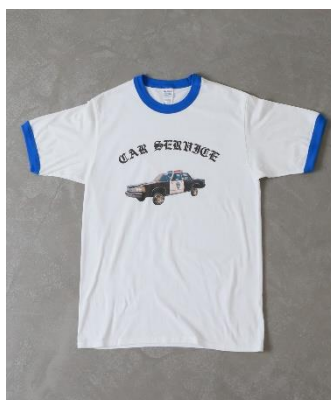
CAR SERVICE POLICE TRIM T-SHIRT Color: WHITE Size: M,L,XL Price: ¥ 7,000 (税抜)