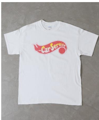
CAR SERVICE FIRE LOGO T-SHIRT Color: WHITE, RED, BLACK Size: M,L,XL Price: ¥ 7,000 (税抜)