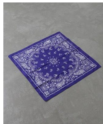
FAKE ASS FLOWERS BANDANA Color: PURPLE Price: ¥ 2,000 (税抜)