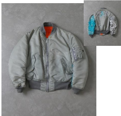
FAKE ASS FLOWERS PAISLEY MA-1 Color: Assort Size: Assort Price: ¥ 49,800 (税抜)