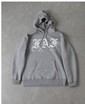
FAKE ASS FLOWERS LOGO HOODIE Color: GRAY, GREEN Size: M,L,XL Price: ¥ 12,800 (税抜)