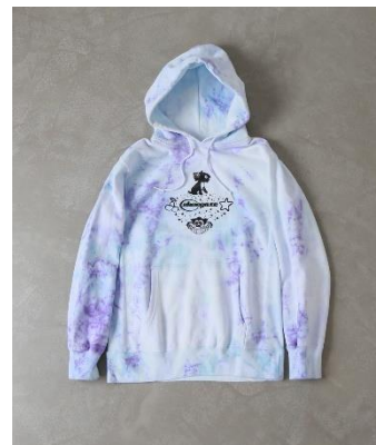
SHOEGAZE SKYPUP HOODIE Color: TYE-DYE Size: M,L,XL Price: ¥ 12,000 (税抜)