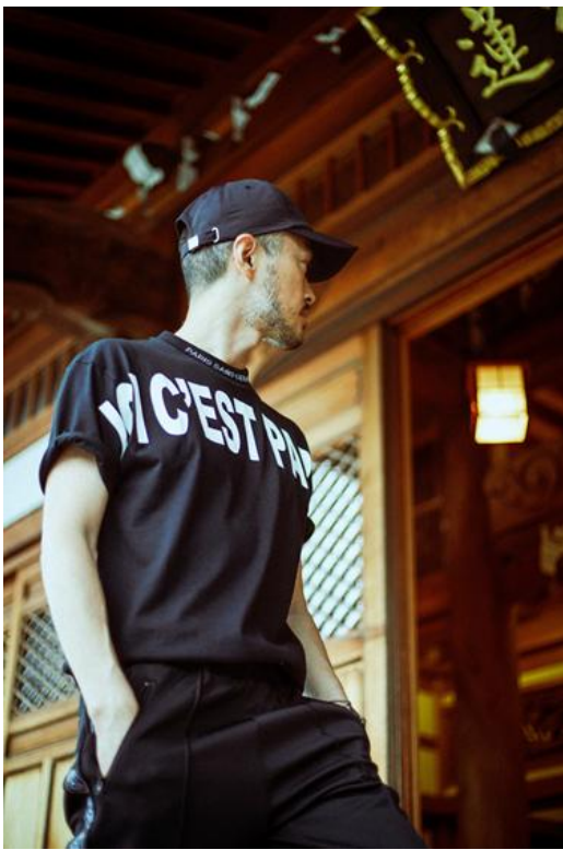
T-SH / ¥6,500- CAP / ¥6,000- COL / BLACK, NAVY, WHITE