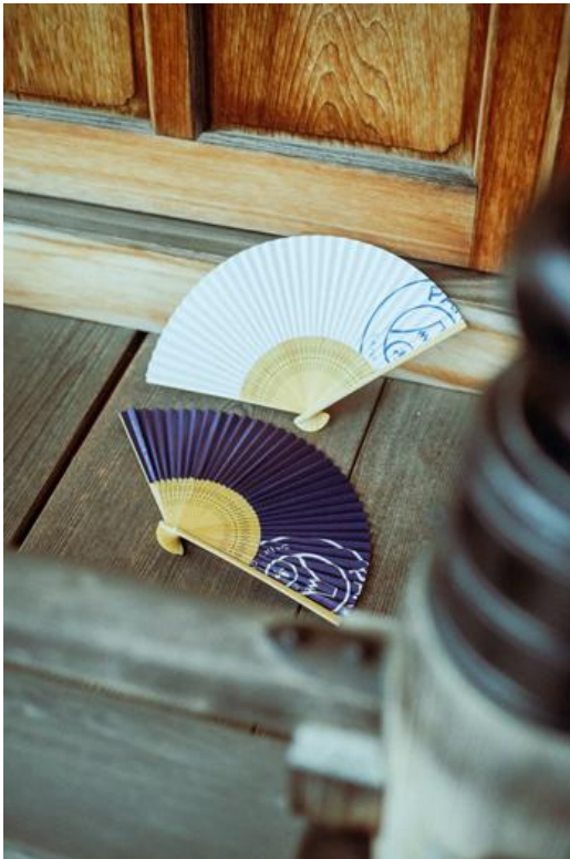
SENSU / ¥2,800- COL / NAVY, WHITE