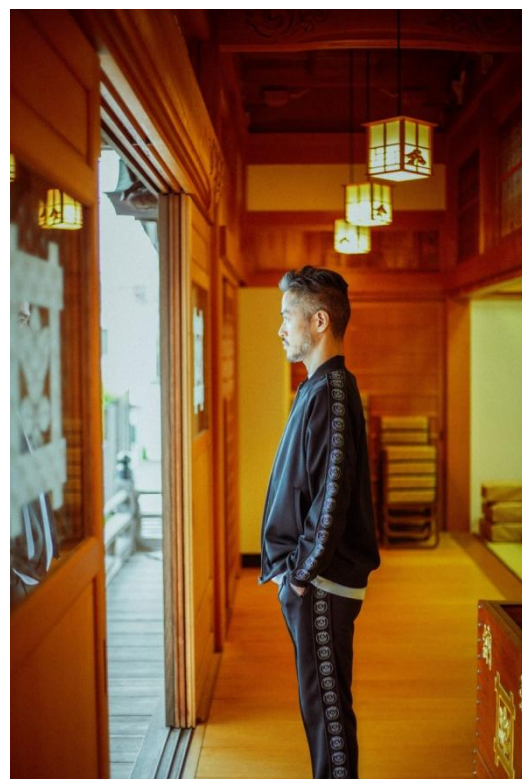
BL / ¥17,000- PT / ¥16,000-