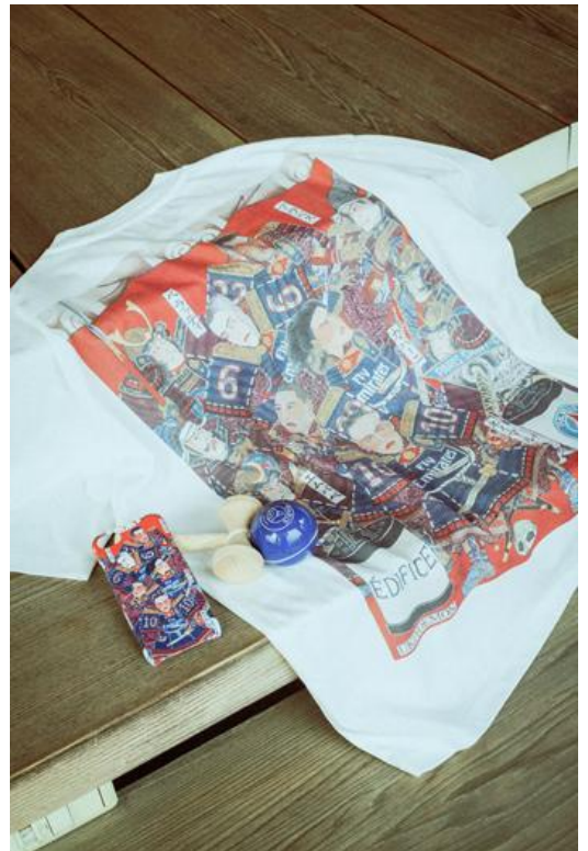
KENDAMA / ¥4,800- I PHONE CASE / ¥2,500- T-SH / ¥7,500-