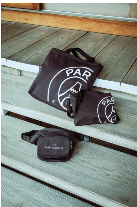
TOTE / ¥7,000- MINI / ¥6,500- WEST / ¥6,500-