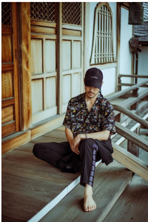
SH / ¥13,000- COL / BLACK, YELLOW, NAVY, WHITE