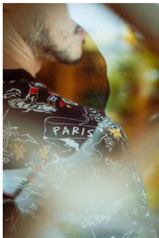
T-SH / ¥9,000- COL / BLACK, YELLOW, NAVY, WHITE