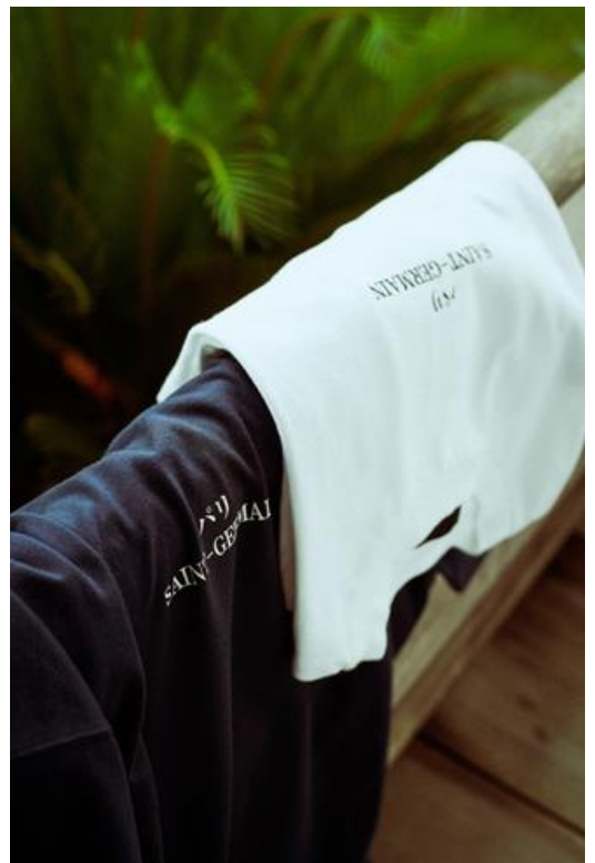
T-SH / ¥6,500- COL / BLACK, NAVY, WHITE