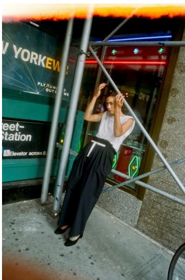
TOPS ¥ 12,000 PANTS ¥ 36,000