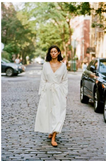
DRESS ¥ 32,000