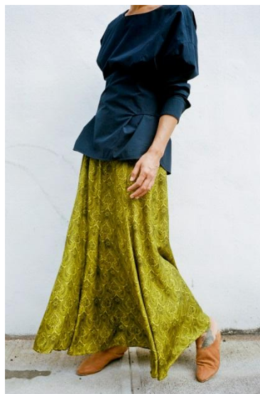
BLOUSE ¥ 26,000 SKIRT ¥ 36,000