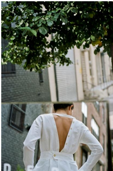
BLOUSE ¥ 26,000