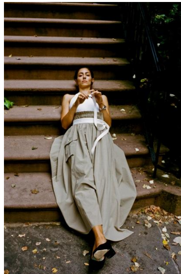
TOPS ¥ 8,000 SKIRT ¥ 36,000