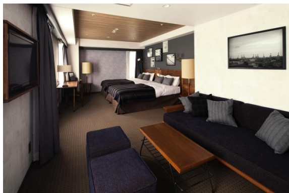
客室 (ツインタイプ)