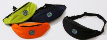
BELTBAG ¥ 5,800-