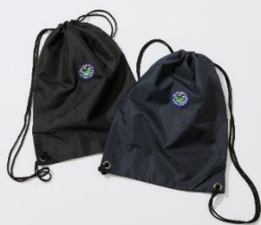
GYMBAG ¥ 3,800-