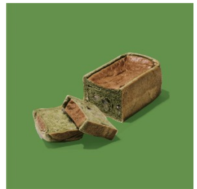
抹茶食パン ¥692 / ハーフ ¥346

定番のカンパーニュに抹茶を練り込み、ホワイトチョコのアクセントを加え、焼き上げました。