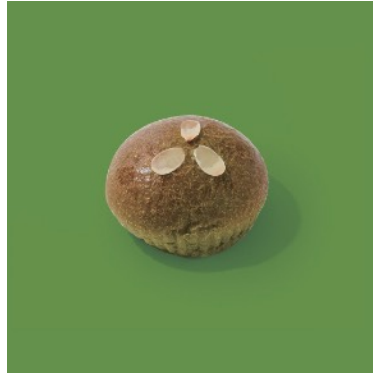
抹茶クリームパン ¥324

当店人気のアンジュ生地に抹茶を練り込み北海道生乳100%使用「YOSHIMI北海道バター」と「十勝産小倉あん」を挟みました。