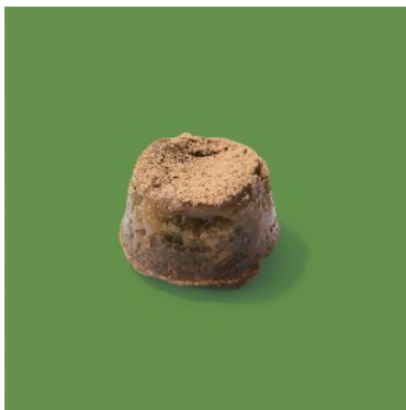
黒蜜ときな粉の抹茶クイニーアマン ¥195

抹茶使用のクロワッサン生地で黒蜜あんなきな粉餅を包み、一口サイズに焼き上げました。