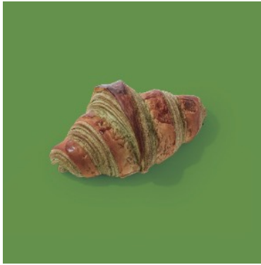
抹茶クロワッサン ¥346