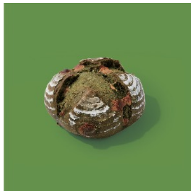
抹茶とホワイトチョコのカンパーニュ ¥497

抹茶使用のクロワッサン生地で黒蜜あんなきな粉餅を包み、一口サイズに焼き上げました。