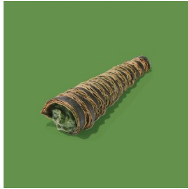
クロワッサンコロネ 抹茶 ¥411

抹茶のクロワッサンを筒状にし、抹茶とホワイトチョコをミックスした自家製ミルククリーム入り