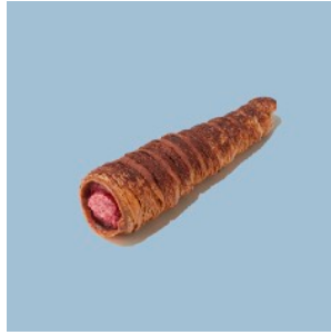
クワッサンコロネ ホワイトチョコ&ラズベリーミルク ¥378

アンジュ食パン生地にチョコチップを練り込み、生チョコクリームを包んで焼き上げました。