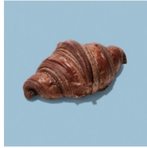
チョコクワッサン ¥303

クワッサンを筒状にした生地に自家製ホワイトチョコ&ラズベリーミルククリーム入り。