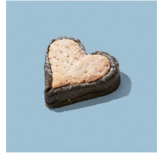
ハートのプリオッシュ ¥324

ドライフルーツ入りのココア生地でミルクチョコを包み、パイ生地と合わせてハート型に。