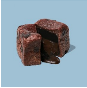
ショコラキューブ ¥378

アンジュ食パン生地にチョコチップを練り込み、生チョコクリームを包んで焼き上げました。