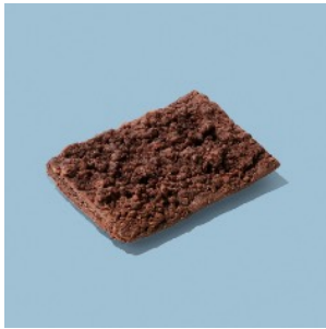
ショコラバナース ¥324

ドライフルーツ入りのココア生地でミルクチョコを包み、パイ生地と合わせてハート型に。