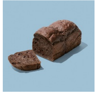
ショコラ食パン ¥756 ハーフ ¥378

ココアクワッサン生地に、ビターチョコと甘酸っぱい完熟イチゴを包み焼き上げました。