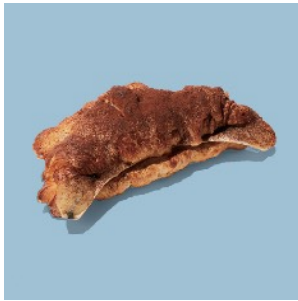
チョコクワッサン バナナダマンド ¥432

カカオタルト生地にショコラアーモンドクリーム、バナナ、カカオクランブルを合わせました。