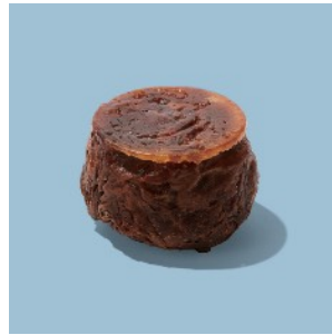
ショコラクイニーマン ¥324

チョコクワッサンを使用したクワッサン・オ・ザマンドにフレッシュバナナを挟んで焼き上げました。