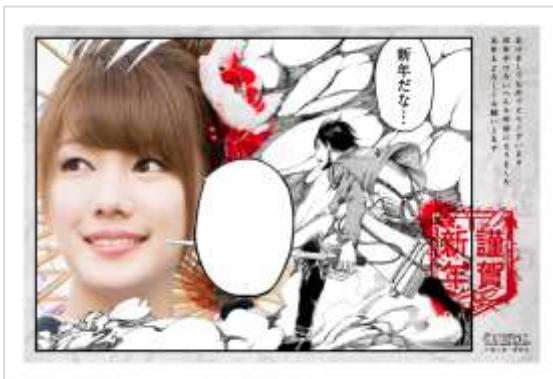
フォトフレームタイプ（※写真挿入例）

「進撃のマンガ年賀状」で選べる年賀状のデザインテンプレートは全 18 種類。原作でおなじみの主人公エレン・イェガー他人気キャラクターや巨人が登場する原作のお気に入りのワンシーンをお選びいただけます。テンプレートの吹き出しにはオリジナルの「台詞」を入れたり、マンガの一コマにお気に入りの「写真」を入れることもでき、世界でたった一枚の年賀状を作成することができます。「スマホで年賀状 2015」（スマホ版）、「ネットで年賀状 2015」（パソコン版）で作成した年賀状は、印刷・発送及び直接投函（ポストへの投函代行）まで便利な一括サービスをご利用いただけます。