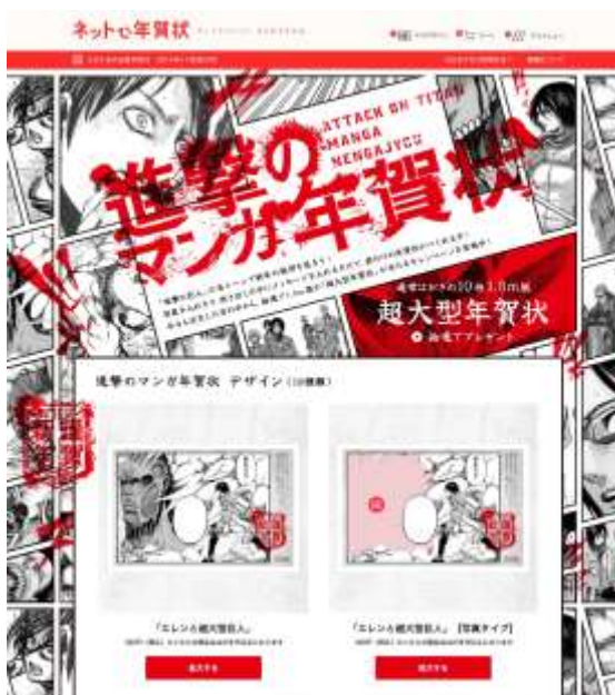
商品ウェブサイトイメージ