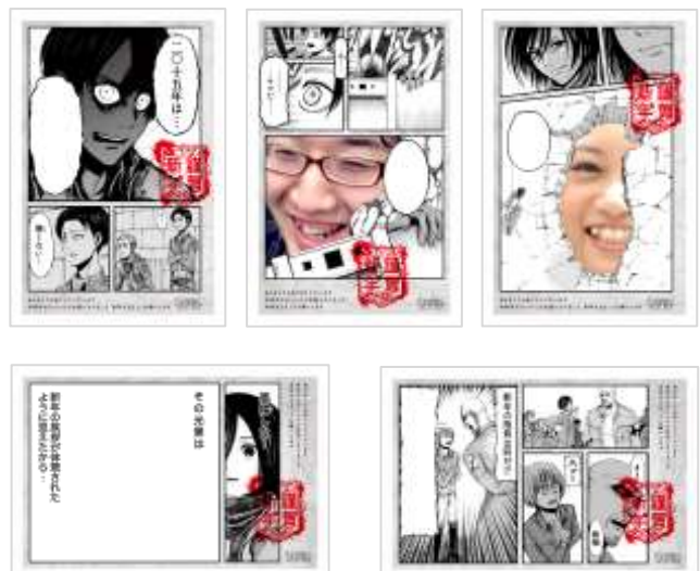
デザインテンプレート例