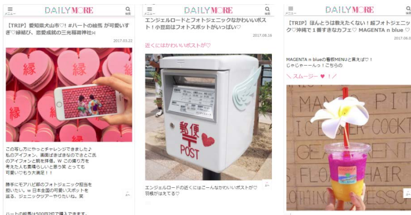
愛知県犬山市の記事