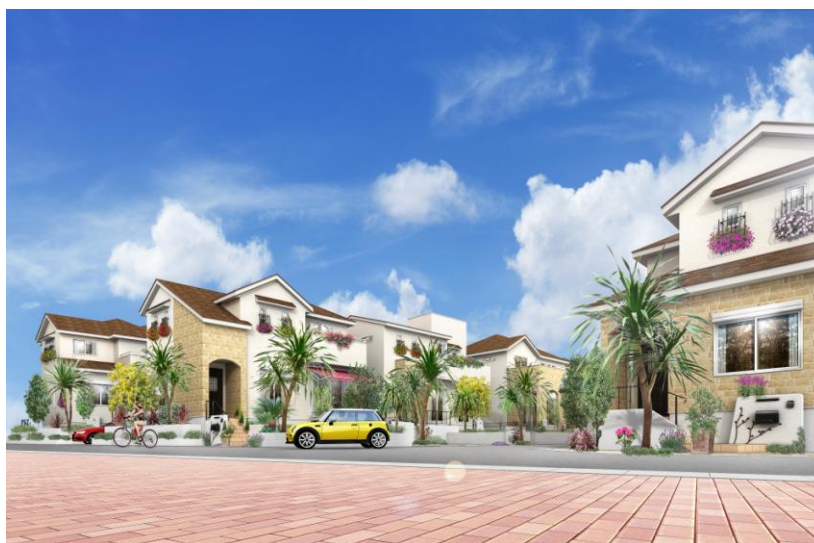
第2弾<オリーブ・カーサ>イメージパース

太陽と青空、吹き抜ける風がさわやかなこの地で、「ハワイ」「地中海」「カリフォルニア」「アジア」の4つのリゾート地をテーマに、街づくりをしてまいります。第1弾として販売されたハワイリゾート街区<アロハ・テラス>は好評売出し中となっております。第2弾となる地中海リゾート街区<オリーブ・カーサ>は島全体がユネスコ世界遺産として登録されているリゾート・イビサをテーマにデザインされ、平和の象徴とされるオリーブを通して心地よい風が吹き抜ける街並みとなります。スペイン・イビサ特有の白い壁をモチーフとしたブラウンの屋根とベージュの石貼調のサイディングがナチュラルな風合いをもたらし、アイアン調の手摺がアクセントとして窓辺を飾ります。