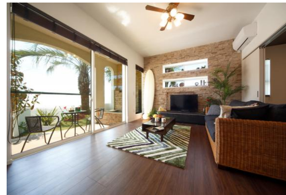
モデルハウス1-4号棟 リビングダイニング

街並み、外観とともに、当然インテリアもハワイリゾート。デザイン性の高いエコカラットや割石の表情が美しいラグナロックなどのアクセントウォールを大胆に活用するとともに、建具も素材感を活かした浮造りタイプ。フローリングもそれらに相応しい木目調や大理石調のものを採用しており、ハワイの高級リゾートのエッセンスを随所に取り入れています。