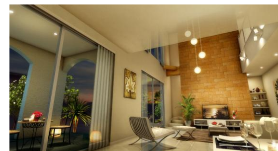
ハレ・パイナ（交流重視）

「パイナ」はハワイ語で、“パーティー”。フルオープンタイルキッチンを中心に、隣接するテラスで家族や友人とホームパーティーができるよう、「見せるインテリア」「外とのつながり」を重視しました。