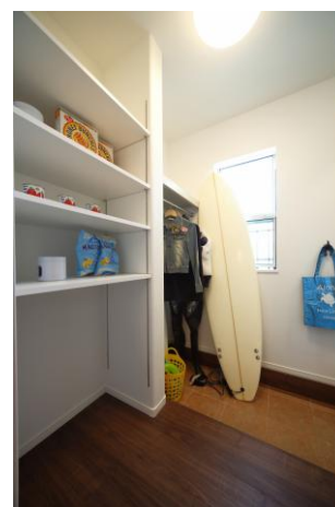
ハレ・ハラウ（趣味重視）

ハワイテイストの家や街並みは、当社の過去の実績からも評判がよく、通常分譲とは違った層（ハワイ大好き）のお客様が広域から集まります。そのような方々は、コンセプトや本物感を重視されますが、今回の物件は、そのような「ハワイ大好き」のお客様にも十分ご納得いただける仕上がりとなっています。