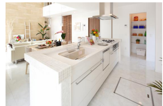
ハレ・ケイキ（子育て重視）

「ケイキ」はハワイ語で“子ども”。子育てをテーマに取り入れた数々のママ楽設計を導入しています。土間収納やパントリー、家事動線の子育てがスムーズに行えるよう設計するなど、ママ目線で空間をつくりあげました。家族がつながりを保てる環境を取り入れています。