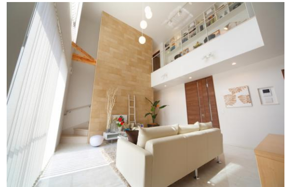
モデルハウス1-3号棟 リビングダイニング

オレンジと赤茶系の屋根と白壁のコントラストが美しい外観。鋳物装飾を施した玄関ドアや洗練されたデザインの妻飾りにガーデングリル。深い庇のあるポーチやバルコニーが、住まいに奥行きを与え、存在感を際立たせます。デッキチェアが似合うテラスに面した庭には、ドラセナやフェイジョアなど南国の木。そして街区の入り口には巨大なココスヤシも植えられており、街全体がハワイリゾートの雰囲気にも包まれています。