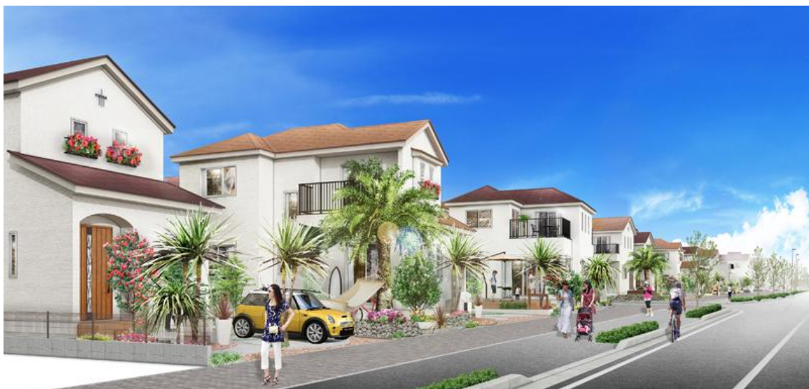
第1期<アロハ・テラス>イメージパース

その中で、大好きなリゾート地を訪れたような心地よさのある空間や景観を実現しています。