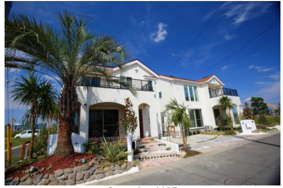
モデルハウス外観

「ハワイ」「地中海」「カリフォルニア」「アジア」の4つの異なるリゾート地をテーマにしなが、南国のリゾート地に共通するココスヤシやドラセナ（ニオイシュロラン）を全体にバランス良く配置しました。また、それぞれの住戸に配置されるフェイジョアはエキゾチックな花と果実が魅力で、季節と共に花が咲き実を結びます。その他ストリートごとに異なる樹種を選定し、それぞれのテーマらしさを演出するとともに4つのリゾートが融合した美しい景観をつくりあげる予定です。