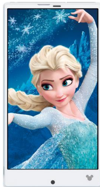
「ディズニー・モバイル・オン・ドコモ」最新機種「SH-02G」