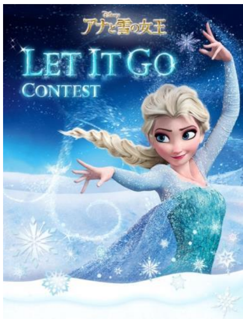
「Let It Go CONTEST」キービジュアル

「SH-02G」は、「アナと雪の女王」のコンテンツをふんだんに用いた、ディズニーイルミネーションが楽しめる最新機種です。