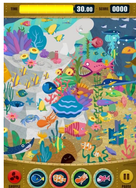
「ドリーをさがせ！」イベント画面