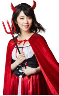
ハロウィンジャンボ宝くじ CM キャラクター 島崎遥香さん