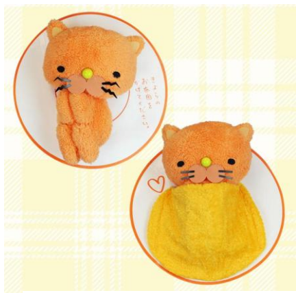
BIG ぬいぐるみ(全2種/約35cm) 「かけてください」「おふとん」