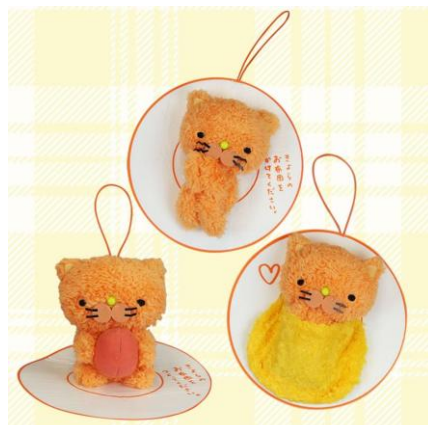
大きめマスコット(全3種/約12cm) 「かけてください」「おふとん」「つくってください」

寝冷えネコ(きよニャ)は、鶏卵大手のアキタが販売するブランドたまご「きよら グルメ仕立て」の TVCM に登場するケチャップライスでできたキャラクターです。昨年10月に放映開始された同 CM は、CM 総研が発表する2015年度(2015年4月～2016年3月度)の「CM 好感度調査」において、飛躍的に好感度を伸ばした躍進企業である「躍進部門」で第4位、新規 CM 参入した企業では同部門第1位となるなど、大変高い評価を頂いています。また、SNS 上でも、ケチャップライスとたまごで寝冷えネコ(きよニャ)のキャラ弁を作り、写真をアップする人が続出するなど、大人気のキャラクターとなっています。