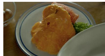
かぶっちゃった篇