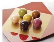
浅草の本店他で販売

カラフルな餡を寒天でくるんだ球形の和菓子。舟和の人気商品。味は6種あり、いずれも甘みがおさえられていて食べやすい。また、「インスタ映え」する色合いの華やかさは、味だけでなく見た目も楽しめる。