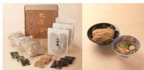
東京ラーメンストリート他にて販売

東京を代表するラーメン店のつけめん。「手土産というお菓子が多いですが、変わり種で喜んでもらえるかも」と森田編集長もおすすめの一品。