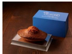
エシレ・メゾン デュ ブール (丸の内) にて販売

A.O.P. (※) 認定のフランス産発酵バター「エシレ」の専門店「エシレ・メゾン デュ ブール」で人気の大きなマドレーヌ。開けた瞬間のインパクトが強く、もらった相手は驚くこと間違いなしの、おすすめの商品。また、「真っ青なエシレロゴのパッケージが目立ち、インパクト大。大人数でシェアして食べるのも楽しい」と森田編集長も絶賛。