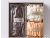
フィオレンティーナ ペストリーブティックで販売

クッキーやチョコ菓子などを目的や予算に応じて組み合わせ可能。ホテルメイドの華やかなスイーツを先方の人数や好みに合わせて選ぶことができ、送られる側も送る側も楽しめる高級感の溢れる品。