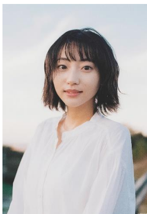
武田 玲奈 Takeda Rena

1997年7月27日福島県生まれ。2014年雑誌『Popteen』レギュラーモデルとして芸能活動をスタートし、2016年4月から2021年1月まで『non-no』専属モデルを務めた。2015年3月映画『暗殺教室』で女優デビューを果たす。