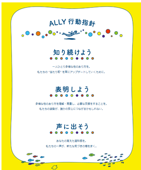
リクルート従業員を対象にした ALLY 行動指針