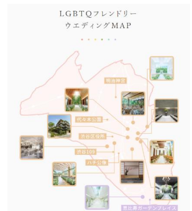
ゼクシイと渋谷区が協働した LGBTQ フレンドリーウエディング MAP