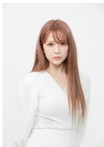
村重 杏奈 anna murashige

元HKT48一期生。父が日本人、母がロシア人というハーフタレント。明るく独特なポジティブキャラでバラエティー中心に活躍する一方、ハーフの容姿を生かしモデルとしても活躍の幅を広げて多方面で活躍している。