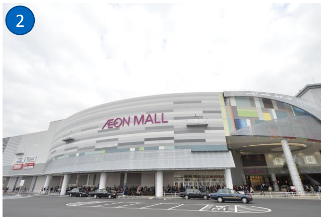
①「天神川駅」 ②広島最大規模の「イオンモール広島府中」