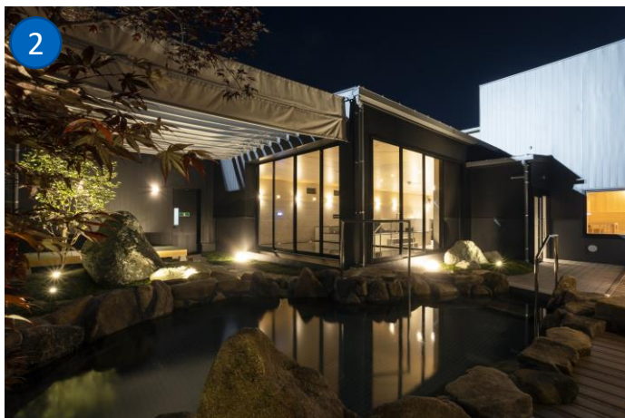
①2022年にリニューアルした「イオンモール広島祇園」 ②温浴施設「スパシーレ祇園」の露天風呂