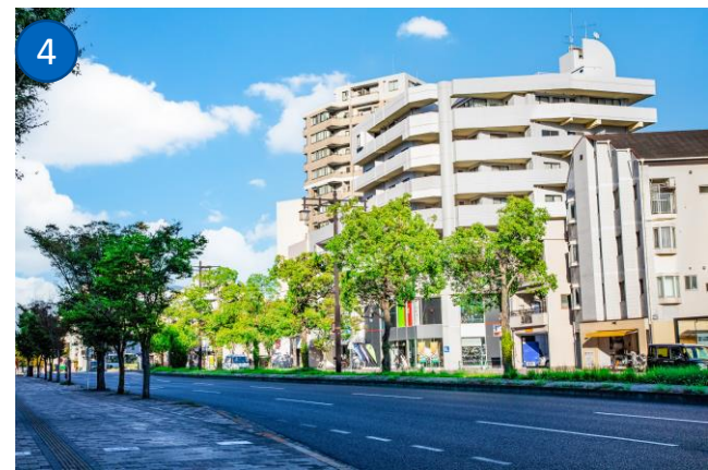
①広島市内に広がる「広島電鉄」 ②「広島駅」南口 路面電車乗り場 ③「広島駅」新幹線口周辺 ④「段原南1丁目」付近の市街地風景