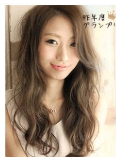
▲2014年度の1番人気は、肩の力が抜けたリラックスイーブ（363票）

12月4日（木）から投票を開始し、ここで選ばれた栄えある上位10作品は2015年1月末にWEB『ホットペッパービューティー』と情報誌『HOT PEPPER Beauty（2月号）』で発表し、2015年春のトレンドスタイルとして発信していきます。