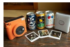
※長野県限定プラン特典