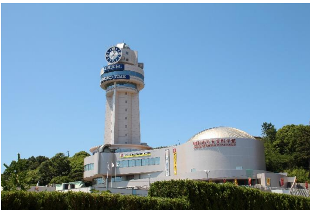
明石市立天文科学館

・駅の総合ランキング1位の人丸前駅は、山陽電気鉄道本線の明石市内の駅で、駅の北には日本標準時子午線で知られる明石市立天文科学館がある。また駅の南方面には、海水浴場や多目的広場、芝生の広場などもある「大蔵海岸公園」が広がり、様々な世代に利用されている。子育てや、教育環境の項目以外でも「公共施設が充実している（図書館、コミュニティセンター、公民館など）」で7位にランクイン、明石市の偏差値と比較してもより高いポイントになっており、身近に利用できる施設が多いことが評価されたようだ。明石市の施策で明石海浜プール（小学生以下）、天文科学館（高校生以下）、文化博物館（中学生以下）、親子交流スペース「ハレハレ」（小学生以下の子供と保護者）が無料となっており気軽に利用できる。「子育て環境が充実している駅ランキング」では人丸前が2位、同じく、山陽電鉄本線の東二見が3位、西新町が4位、魚住が7位、大久保が8位、明石が10位と明石市内の駅が上位を占めた（13ページに記載）。