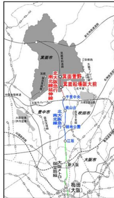
千里中央駅から箕面船場阪大前駅、箕面萱野駅位置図（箕面市ホームページより）