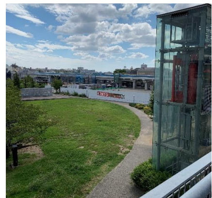
箕面萱野駅予定地はみのおキューズモールに隣接