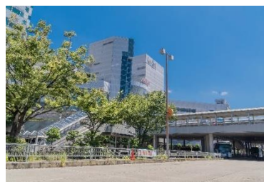
野田駅（阪神） /野田阪神駅周辺

福島区はこの10年余りで、新築マンションの供給が相次ぎ人口も増加。イオンをはじめ、スーパーマーケットが区内で27もある（iタウンページより）。街の魅力項目では、生活上の用事を効率的に済ませることができる（1位）、利用しやすい商店街がある（2位）、コストパフォーマンスがよく便利なお店や飲食店がある（1位）、医療施設が充実している（2位）、今後、街が発展しそう（2位）など、利便性や将来への期待で上位となった。