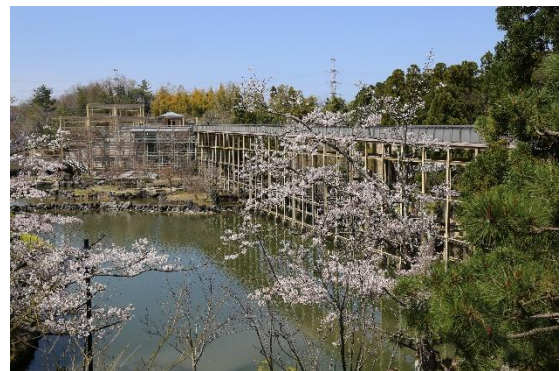
けいはんな記念公園、京都府立関西文化学術研究都市記念公園

相楽郡精華町は関西文化学術研究都市の中心として官民の研究機関が集まり、宅地供給も豊富な職住近接の街。「住宅街が整然としている」「防犯対策がしっかりしており治安が良い」、「散歩・ジョギングがしやすい」などで関西1位を獲得。