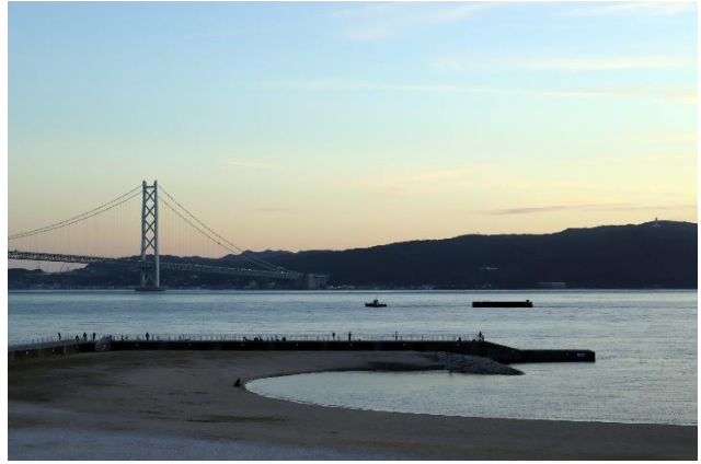
大蔵海岸公園