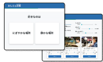
※「おしごと診断」では自分のパーソナリティに合った仕事を検索