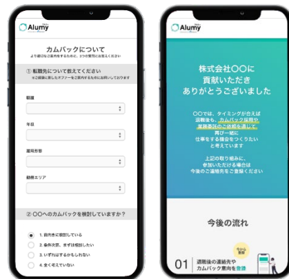
▲登録フォームイメージ

海外においては、「アルムナイ（退職者）」ネットワークサービスは既に浸透していますが、日本においてはまだまだ仕組みが不十分な状況です。リクルートとしてスピーディに『Alummy』の事業化検証を行い、より多くの企業に導入いただくことを目指していきます。