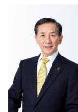
堀内 茂 富士吉田市市長

また、体験プログラム造成事業においても、年間を通じて、100 ものコンテンツが生まれ、近年“物見”の観光から“体験する”観光へとの変わりつつある観光の流れに乗った観光事業が展開され、地元の事業者と観光客とのコミュニケーションも生まれることで、リピーターの要因にもなっていると聞き及んでおります。