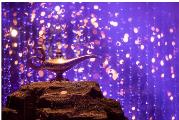
会場中央にある「魔法のランプ」

カレッタ汐留では、ディズニー映画『アラジン』のMovieNEX 発売を記念して、『アラジン』の世界観をイメージした「Caretta Illumination 2019 ～アラビアンナイト～」を開催中です。各メディアで取り上げられるなど話題となり、開始から1ヶ月を待たずしてイベント来場者数35万人を突破したカレッタイルミネーション。今期大注目のイルミネーションスポットとなっておりますが、2020年1月11日(土)から2月14日(金)までの期間中、土日祝日限定で、『アラジン』の人気楽曲「ホール・ニュー・ワールド」と「スピーチレス～心の声」の日本語楽曲スペシャルプログラム、題して「かっぺたいるみねーしょん 2019 ～あらびあんないと～」を上演することが決定いたしました。