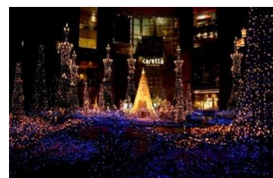
※画像はイメージです