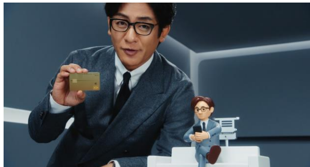
「JCB オリジナルシリーズ講座・ワンタイムパスワード」篇より

株式会社ジェーシービー(本社：東京都港区、代表取締役兼執行役員社長：二重 孝好、以下：JCB)は、歌舞伎俳優の片岡愛之助さんをイメージキャラクターとして起用したJCBオリジナルシリーズの第3弾CM「JCB オリジナルシリーズ講座・ワンタイムパスワード」篇、「JCB オリジナルシリーズ講座・安心設定ステータス」篇（各15秒）を12月5日（火）から全国で放送します。また、新登場となる年会費無料の商品「JCBカードS」に関するWEB CMも同日よりJCB公式YouTubeチャンネルで公開いたします。