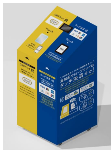
専用端末（イメージ）

小田急箱根グループでは、タッチ決済とQR チケットで周遊観光の環境整備を推進してまいります。なお、ロープウェイに国際ブランドのタッチ決済を導入するのは、全国初の取り組みです。