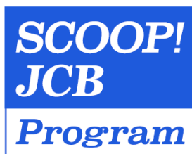
<SCOOP! JCB Program ロゴ>

ブランドキャンペーンとは、JCB ブランドのカード(JCB のロゴがついている、カード番号が 35 から始まるカード)をお持ちのすべての会員様を対象としたおトクなキャンペーンです。このような活動を通し、お客様に選ばれるカードブランドをめざしてまいります。