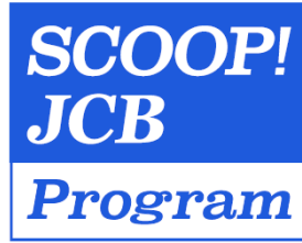
<SCOOP! JCB Program ロゴ>

ブランドキャンペーンとは、JCB ブランドのカード（JCB のロゴがついている、カード番号が 35 から始まるカード）をお持ちのすべての会員様を対象としたおトクなキャンペーンです。このような活動を通し、お客様に選ばれるカードブランドをめざしてまいります。