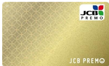
縁(えにし・ゴールド)

JCB のウェブサイト から「フォームでのお問い合わせ」ボタンよりお問い合わせください。