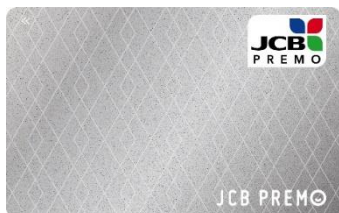
絆(きずな・シルバー)

縁起のよい文様である「七宝」をモチーフにしたデザインです。 ご縁・円満・調和という願いを込めています。