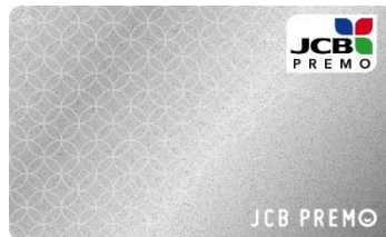
縁(えにし・シルバー)

縁起のよい文様である「七宝」をモチーフにしたデザインです。 ご縁・円満・調和という願いを込めています。