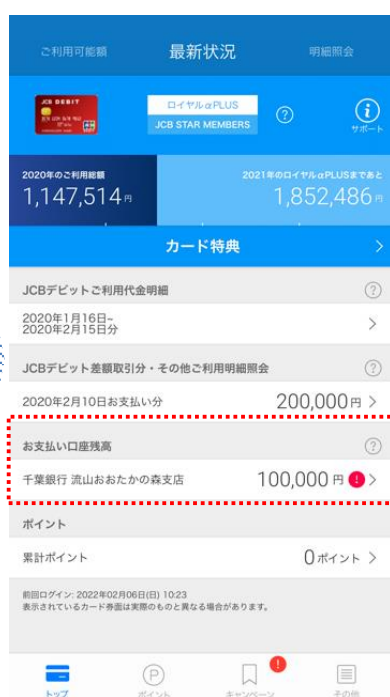
口座残高不足時「！」にてアラート