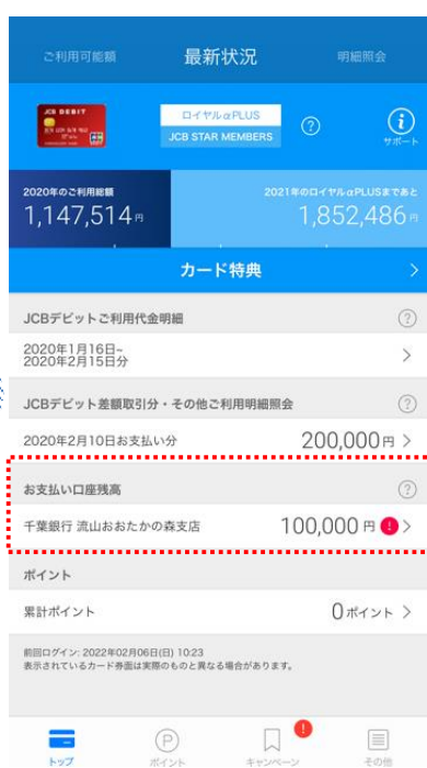
口座残高不足時「！」にてアラート