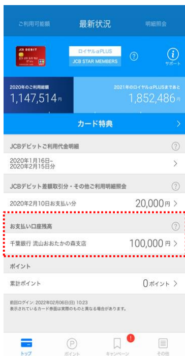
ログイン都度口座残高を更新