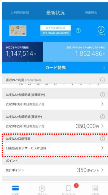
口座残高表示サービスに登録をタップ