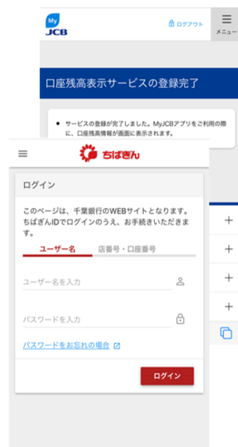
ちばぎん ID/パスワード入力(完了)