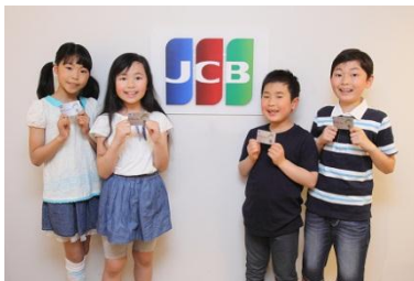
【「e-KidZoカード」利用で復興支援】

なお今回より、「e-KidZoカード」1回の利用につきオリジナルステッカーを1枚、子ども達にプレゼントします。ステッカーを2枚合わせると一つのイラストが完成します。