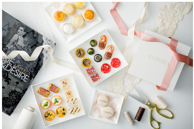
LA PERLA × ST. REGIS アフタヌーンティー