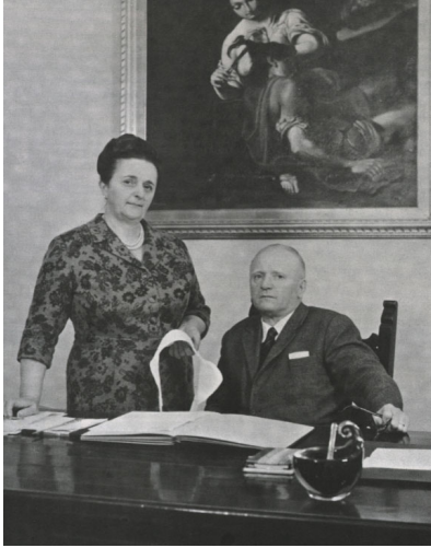
LA PERLA 創始者 アダ・マゾッティ

創始者ジョン・ジェイコブ・アスター4世は、母であるキャロライン・アスター夫人のゲストを魅了する徹底的にこだわったおもてなしを「リチュアル（儀式、作法）」としてサービスに取り入れ、一世紀以上にわたる歴史のなかで伝統として育んできました。そのひとつがアフタヌーンティー。彼女のおもてなしの精神を受け継ぎながら、現代のスタイルに昇華させています。