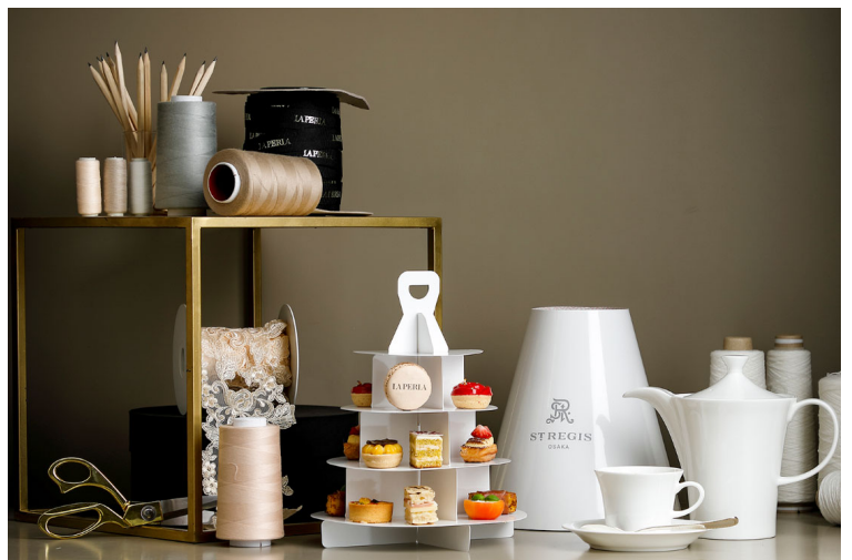
Afternoon Tea Ritual The St. Regis to Go!