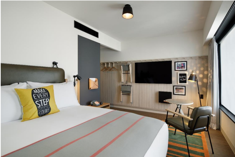
スタンダードルーム

時間を過ごしたいゲストは、ライブラリーでスマートフォンや PC を充電しながらゆっくりとくつろいだり、24 時間営業のフィットネスセンターで、ピンク色のモクシーのパンチングバッグや、スピンバイク、充実したフィットネス用具を使ってすっきりとリフレッシュすることも可能です。