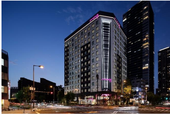
モクシー大阪新梅田外観